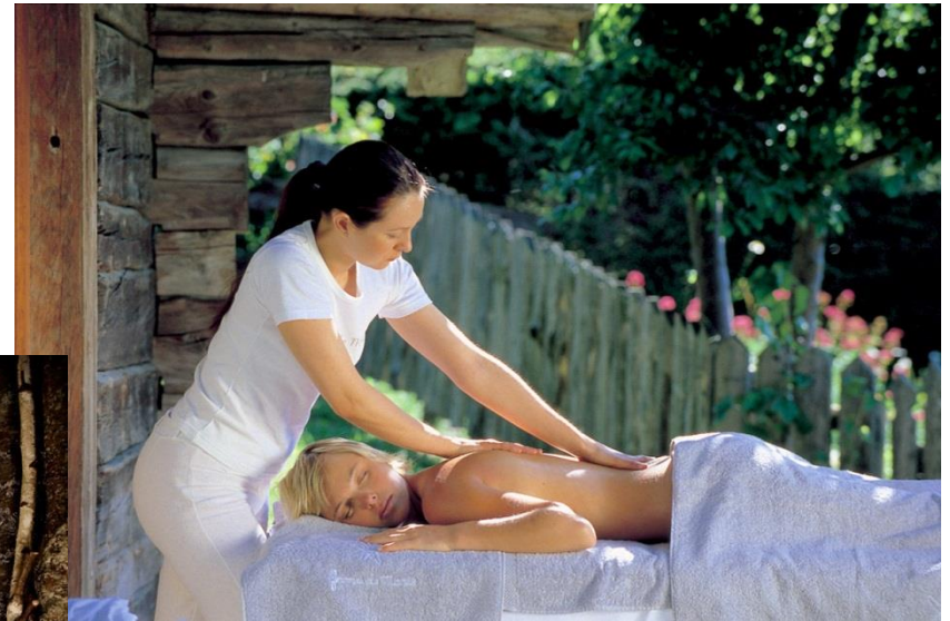
Les Fermes de Marie, France