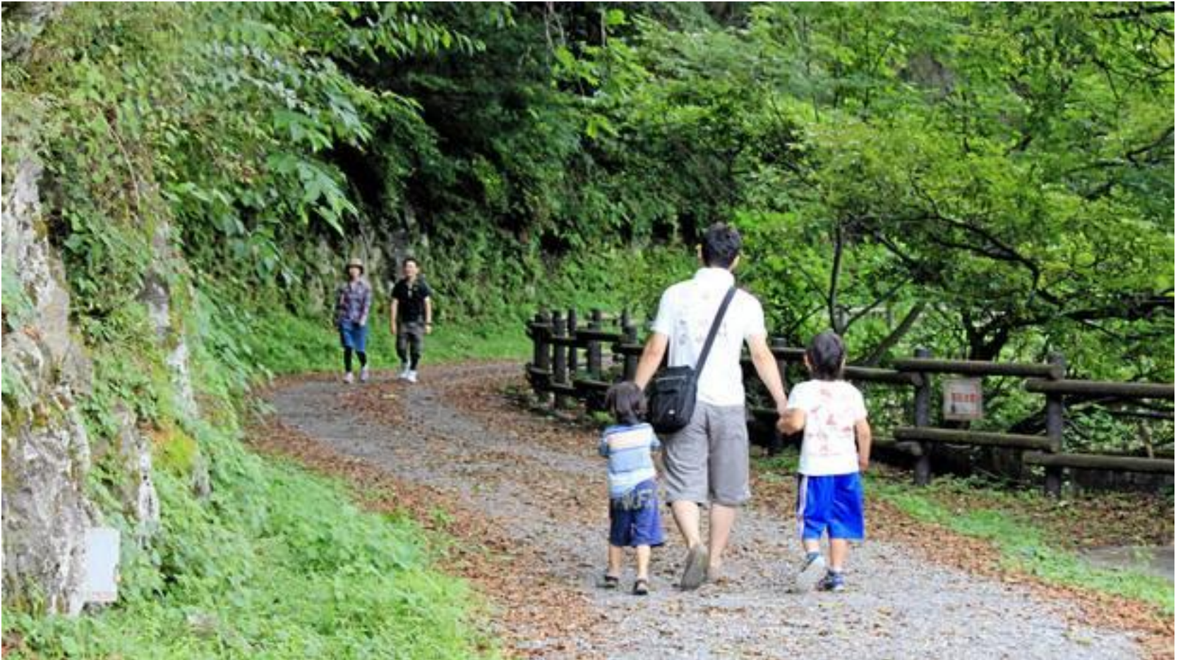
Forest Therapy and Certified Therapy Forests in Japan