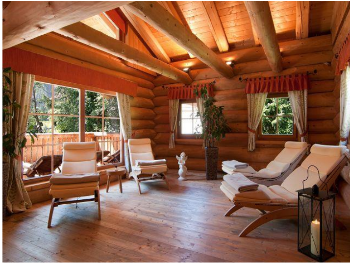
Thermenhotel Ronacher, Austria