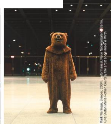
Mirk Wallinger, Sleeper, 2004, Informanssi, Neue Kunstgalerie, Berlin.